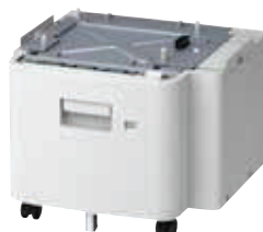
Bandeja 2.000 folhas Código: 45393301