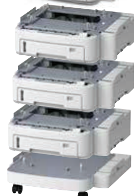
Bandeja 530 folhas Código: 45466501