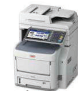
Bandeja 530 folhas Código: 45466501